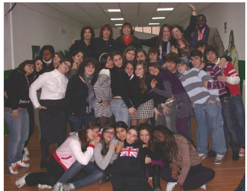
IL CAST DE "UNA CICCIONA ALL'AGRODOLCE"